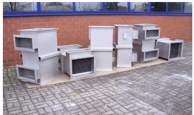
Durch kluge Anordnung dünner Bleche lässt sich auf kleinstem Raum eine große Kühlfläche unterbringen, in diesem Fall 40 Quadratmeter.