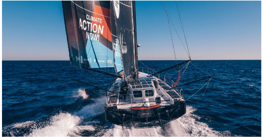
Greenboats nutzt Ansys, um Bootsteile mit selbstentwickelten Rohstoffen und Strukturteile richtig zu dimensionieren.

IT Administrator Karl Marbach GmbH & Co. KG