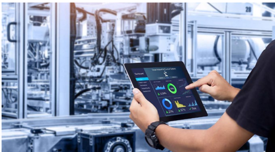
Bringen Sie Ihr Unternehmen mit IIoT durch eine intelligent vernetzte Fertigung weiter.