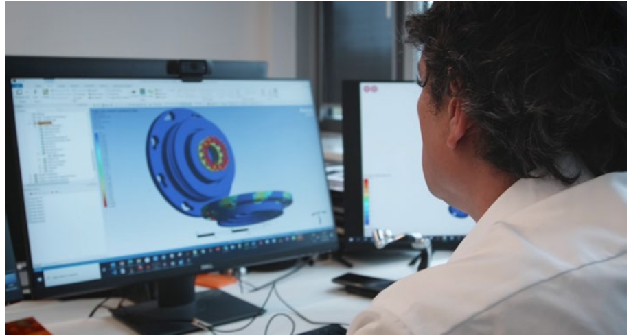
Agile Robots verwendet Ansys-Simulationssoftware in der Entwicklung von Robotik-Lösungen.

Design and Engineering Rüegg Cheminée Schweiz AG