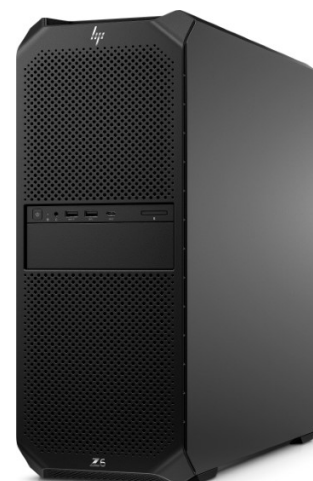
Beispiellose Leistung für Ihre professionellen Workflows: Die HP Z6 G5 A Tower Workstation mit AMD Prozessor

CAD Responsible/Admin Butting Anlagenbau GmbH & Co. KG